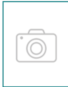
9. IRENA HORVAT DOLINA